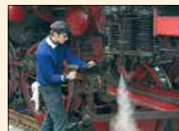
Wartung der historischen Fahrzeuge durch fachkundige Mitglieder

1969 machten sich in Ulm/Donau einige Eisenbahnfreunde Gedanken über die Erhaltung von historisch wertvollem Eisenbahnmaterial. 1971 kam es dann zur Gründung des Vereins der Ulmer Eisenbahnfreunde e.V. Die bundesweit über 600 Mitglieder betreuen heute 9 Dampflokomotiven, einige andere Triebfahrzeuge und mehrere Dutzend Wagen. Viele wurden in mühevoller Arbeit restauriert und repräsentieren heute einen breiten Querschnitt historischer Eisenbahnfahrzeuge. Die meisten Fahrzeuge sind betriebsfähig und werden bei regelmäßigen historischen Dampfzugfahrten von Ettlingen Stadt nach Bad Herrenalb, von Amstetten nach Gerstetten oder Oppingen und bei Sonderfahrten in fast ganz Europa eingesetzt.