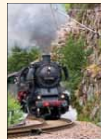
Der Dampfzug passiert schroffe Felsen bei Schwarzenberg.