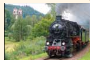
Das liebevolle Albtal – aber auch die Seitentäler laden zum (Rad-)Wandern ein.

Nach der Übernahme der Murgtalstrecke durch die AVG fahren dort wieder regelmäßig historische Dampfzüge. Die Fahrt beginnt am Karlsruher Hauptbahnhof. In Rastatt verlassen wir das Rheintal entlang der Murg in Richtung Osten und kommen über Kuppenheim und Bad Rotenfels nach Gaggenau und später nach Gernsbach. Weiter fährt der Dampfzug bei Obertsrot am hoch über dem Murgtal thronenden Schloss Eberstein vorbei in das immer enger werdende Tal und erreicht Hilpertsau. Ab Weisenbach wird der Gebirgsbahncharakter durch zahlreiche Brücken und Tunneln unterstrichen. Besonders sehenswert ist der Tennenschluchtviadukt kurz hinter Langenbrand-Bermersbach, eine der wenigen erhaltenen originalen Steinbrücken. Nach Passieren von Forbach mit seiner charakteristischen Kirche, Raumünzach und Schönmünzach weitet sich das Tal hinter Schwarzenberg und bald wird über Klosterreichenbach der Kurort Baiersbronn, das Ende unserer Dampfzugfahrt, erreicht. Von hier kann man eine der zahlreichen Wandermöglichkeiten nutzen oder mit der Stadtbahn die wenigen Kilometer über die Steilstrecke nach Freudenstadt fahren. Auch im Murgtal gibt es einen gut ausgebauten Radweg, meist parallel zur Bahn, nach Rastatt.