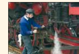
Wartung der historischen Fahrzeuge durch fachkundige Mitglieder

1969 machten sich in Ulm/Donau einige Eisenbahnfreunde Gedanken über die Erhaltung von historisch wertvollem Eisenbahnmaterial. 1971 kam es dann zur Gründung des Vereins der Ulmer Eisenbahnfreunde e.V. Die bundesweit über 600 Mitglieder betreuen heute 12 Dampflokomotiven, einige andere Triebfahrzeuge und mehrere Dutzend Wagen. Viele wurden in mühevoller Arbeit restauriert und repräsentieren heute einen breiten Querschnitt historischer Eisenbahnfahrzeuge. Die meisten Fahrzeuge sind betriebsfähig und werden bei regelmäßigen historischen Dampfzugfahrten von Ettlingen Stadt nach Bad Herrenalb, von Amstetten nach Gerstetten oder Oppingen und bei Sonderfahrten in fast ganz Europa eingesetzt.